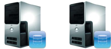
WinGuard Server Hot Standby Server